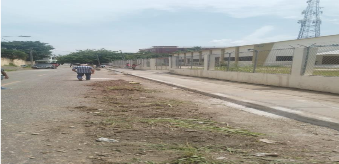
4- Sector La Victorina, Construcción de Contenes y Acondicionamiento de Calles. Sector La Victorina, Najayo Arriba.