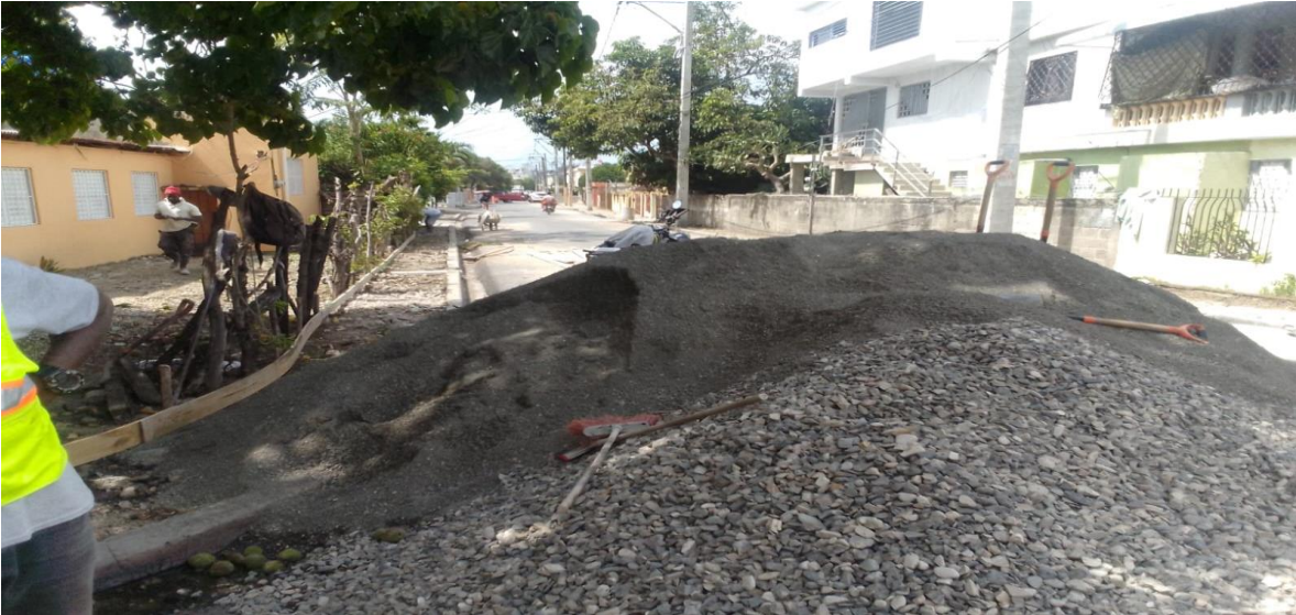
6-Sector Las Eneas, Construcción de Contenes y Acondicionamiento de Calles. Sector Las Eneas, Najayo Arriba.